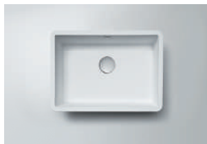
Lavatório 4530 L 450 x 300 x 110 mm