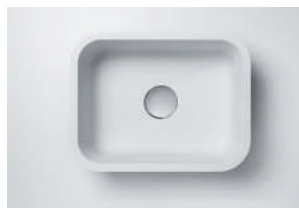
Cuba 871 531 x 397 x 188 mm