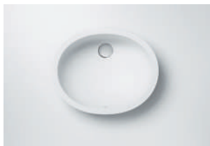
Lavatório 810 418 x 332 x 138 mm