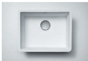
Cuba 970 L 530 x 400 x 175 mm