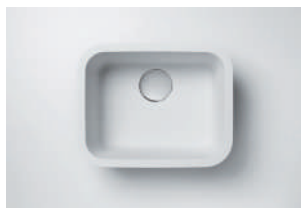
Cuba 859 440 x 340 x 200 mm

As cubas e os lavatórios fabricados pela DuPont estão disponíveis na cor Glacier White. São modelos versáteis que atendem desde cozinhas e banheiros de residências até hospitais, restaurantes e hotéis. Quando colados em tampos, também de Corian®, o acabamento fica perfeito, parecendo uma única peça. Integrados, as cubas e os lavatórios não formam frestas, o que evita o acúmulo de sujeira e água, facilitando a limpeza e a higiene. Outras opções de formato e cor podem ser fabricadas, sob medida, por processadores autorizados DuPont™ Corian®.