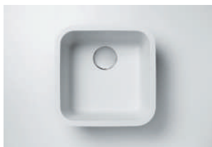
Cuba 804 399 x 399 x 208 mm