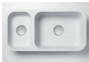
Cuba 873 823 x 399 x 115/191 mm