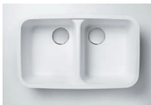
Cuba 850 734 x 423 x 227 mm